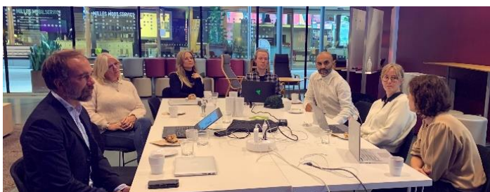
Møte i Visual Arena, Gøteborg 04.10.21

Vi skal utvikle en utdanning, kompetanseutvikling og forskningsplan, og det er viktig for oss at vi får en helhetlig plan som bidrar til at XR teknologien blir satt på dagsorden tidlig i utdanningsløpet. Det finnes nesten ikke slikt tilbud i videregående skole og vi det må tilrettelegges for de nye mulighetene som XR teknologien representerer. Byremo videregående skole ønsket en innføring i hva vi arbeider med og vi hadde teamsmøte med store deler av staben med presentasjon av Agder XR og potensialene knyttet til denne teknologien.